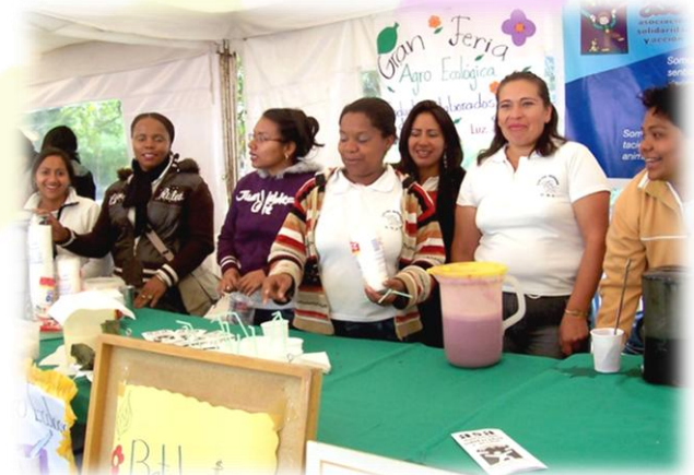
Centro de Desarrollo Infantil "Luz del Mañana" – Corazón de Jesús

Apuntamos a la educación como medio primordial para construir la identidad y el desarrollo personal y social