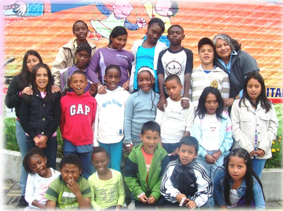
Niños y niñas de los Centros de Apoyo Escolar "Guadalupe" y "San Lucas" participantes en el Consejo Consultivo de la Niñez y Adolescencia de Quito – Marzo 2011

Contribuimos al desarrollo de niños, niñas y adolescentes, en función de los principios de universalidad, responsabilidad y protección integral , involucrando a las familias y comunidades, para garantizar el ejercicio pleno de sus derechos .