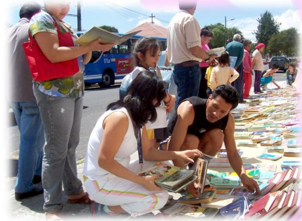
Red de Bibliotecas ASA Feria de Libros